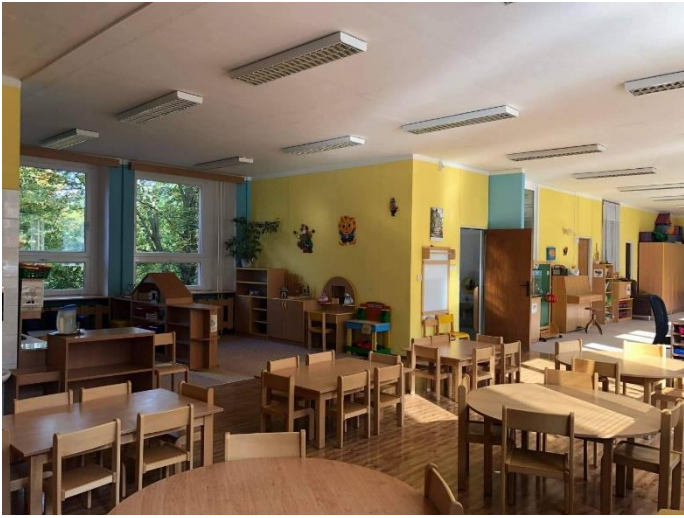
Obrázek 2: Ukázka třídy Chobotniček