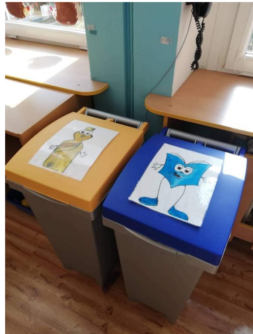
Obrázek 4: Popelnice na třídění odpadu