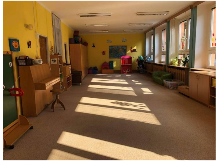
Obrázek 1: Ukázka třídy Chobotniček