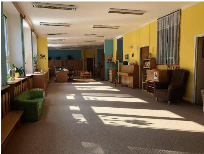
Obrázek 3: Ukázka třídy Chobotniček