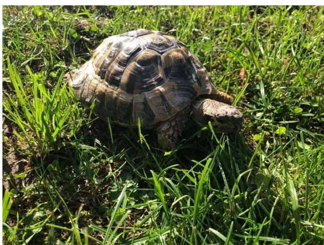
Obrázek 13: Naše želvička Brusinka