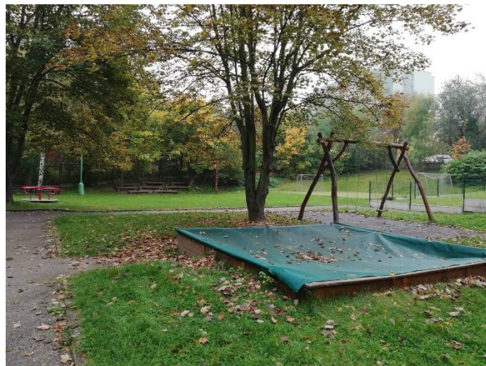
Obrázek 6: Zahrada MŠ