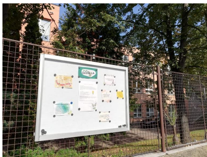
Obrázek 14: Nástěnka Ekotýmu na plotě MŠ pro veřejnost