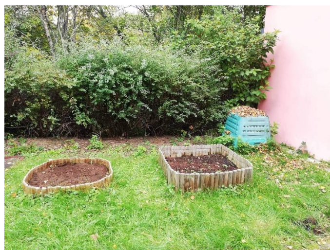
Obrázek 8: Záhonky na pěstování