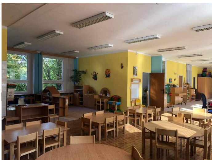
Obrázek 2: Ukázka třídy Chobotniček