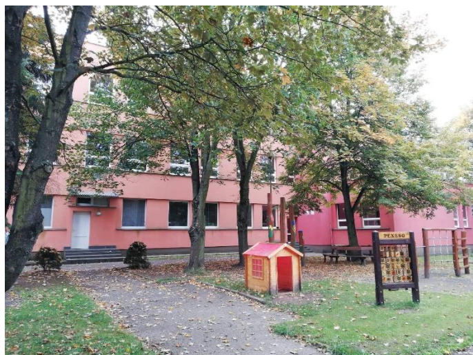
Obrázek 5: Zahrada MŠ