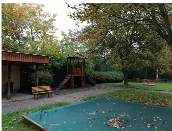
Obrázek 7: Zahrada MŠ