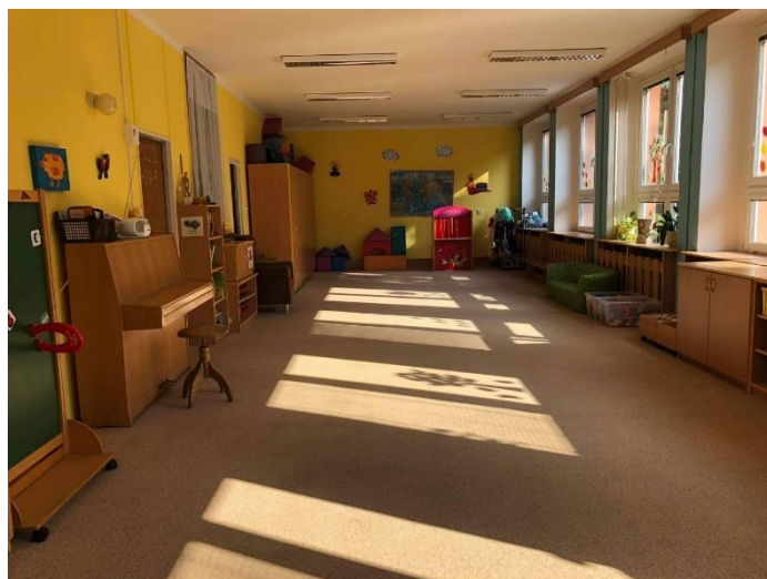
Obrázek 1: Ukázka třídy Chobotniček