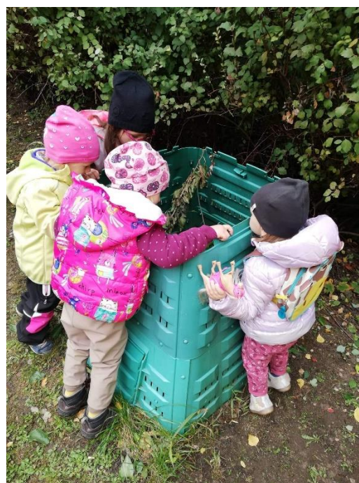
Obrázek 10: Kompostér 2