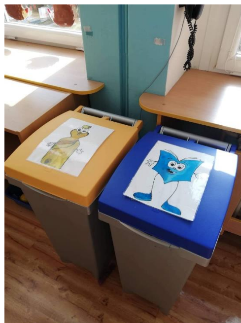
Obrázek 4: Popelnice na třídění odpadu