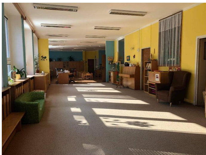
Obrázek 3: Ukázka třídy Chobotniček