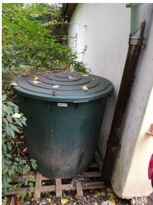
Obrázek 9: Kompostér