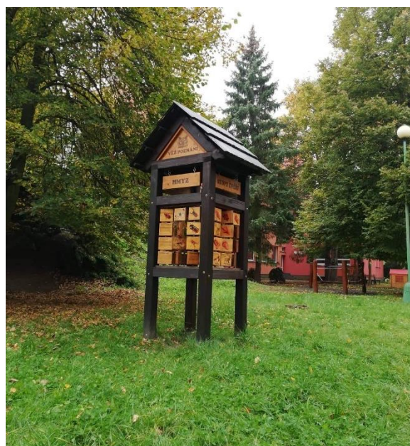
Obrázek 12: Dřevěné puzzle